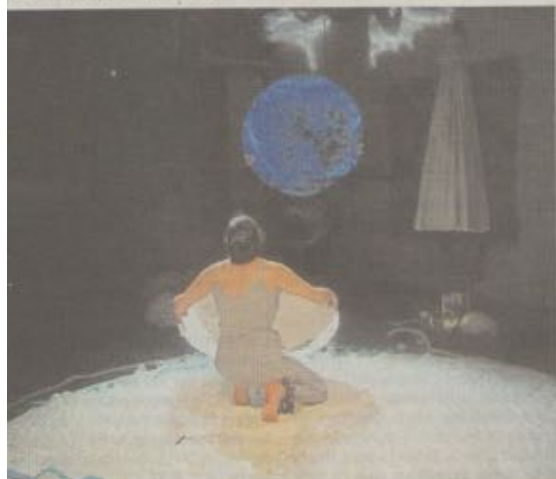
Un moment de poésie et de magie.

Un spectacle à partager avec les moins de 3 ans