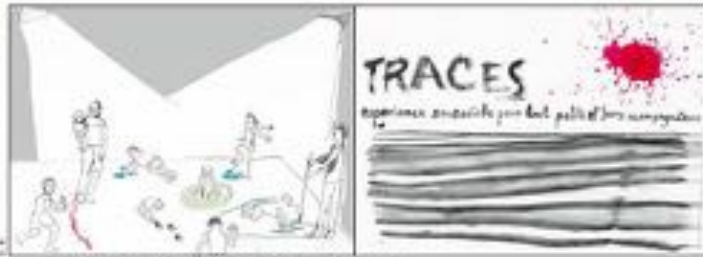
Maquette du projet Traces, porté par la compagnie Nomorpa