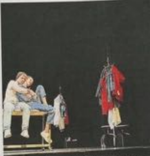
Sur scène, 4 comédiens incarnent les personnages tour à tour.