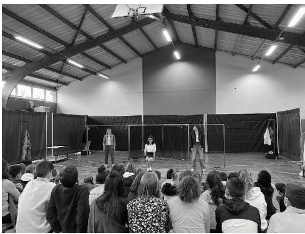
Illustrations des différentes formes de « Mouton noir ». À gauche, en salle équipée, au Centre Brassens d'Avrillé (49) en mars 2021 / à droite, au sein d'un établissement scolaire, dans le cadre du Festival Très Tôt en Scène, au collège St Aubin la Salle à Verrières-en-Anjou (49) en mars 2021, avec la forme autonome.