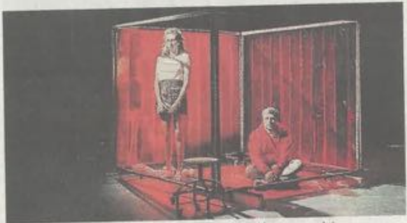
« Mouton noir » traite des mécanismes du harcèlement scolaire.

« Mouton noir », de l'auteur belge Alex Lorette, est destiné aux adolescents et aux adultes. « Pendant que sa mère fait de l'aérobic, des courses et des petits plats, Camille s'enfonce chaque jour un peu plus dans un douloureux quotidien rempli d'humiliations, de pièges et de menaces. Sans doute Camille est-elle une jeune fille