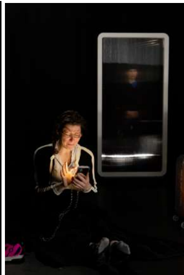
Photos de répétition lors de la résidence au Carré des Arts à Pellouailles-les-Vignes en décembre 2022