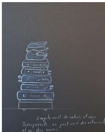
Croquis de Bruno Cury

Une silhouette de téléphone portable de taille humaine, permet de créer des cloisons et de définir certains espaces de la pièce (chambres de la jeune fille, loge des studios télé, haillon arrière de la voiture...).