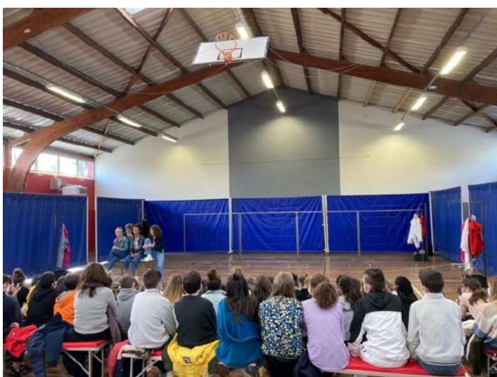
Illustrations de notre forme autonome, dans le cadre de notre tournée scolaire avec le Département de Maine-et-Loire

Lien vers le teaser du spectacle : https://www.youtube.com/watch?v=CR853od0cs8&t=3s